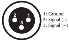
DMX-output XLR mounting-socket: