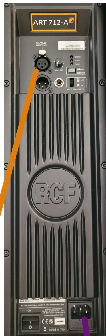
ENCEINTE RCF N°2