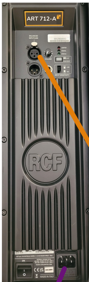
ENCEINTE RCF N°1